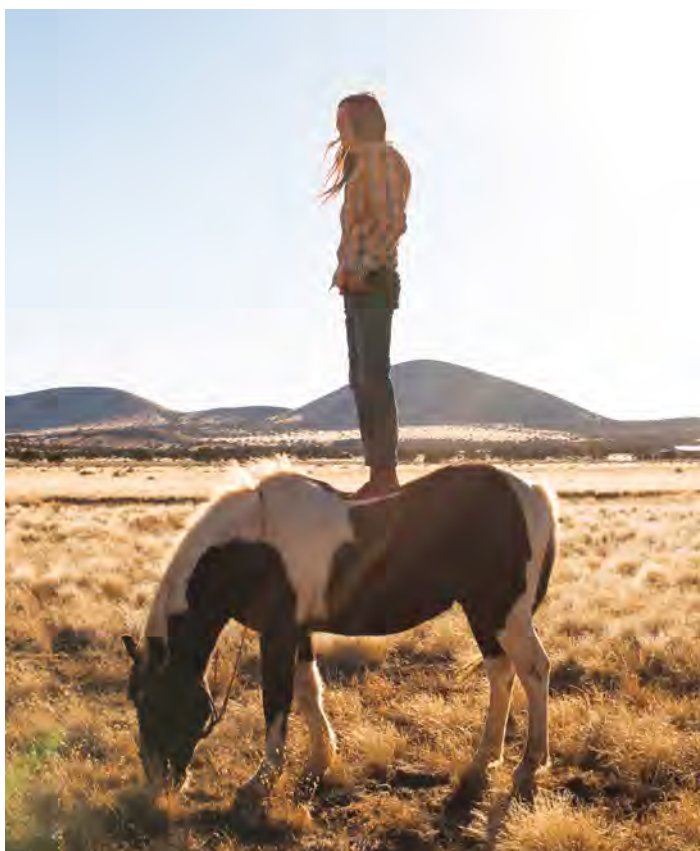
© «Hohzo marcher dans la beauté» par N. Dubuc et S.Barbato